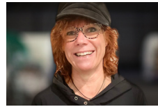
VICTORIA GRAF Lost places, ungewöhnliche Orte modern inszeniert [Video-Installation, Druck- grafik] Radolfzell