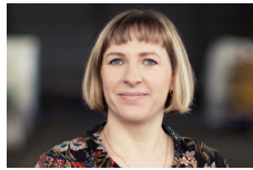
NINA FRAUENKNECHT Reflection of the Forest [Mixed Media- und Öl-Gemälde] Darmstadt