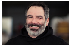
MARIO DE JANEIRO Comic-Style Graffiti [Graffiti-Design mit Live-Performance] Hainburg