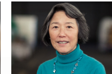
MYEONG-JA ZIMMERER Über den Alpen [Reispapierkollage und Tuschermalerei] Usingen