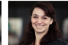
JULIA ULRICH Gone but not forgotten [Öl-Gemälde] Stadtprozelten