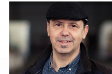
REINHARD WIESIOLLEK ... und zwischen den Bäumen das Licht [Acryl-/Öl-Gemälde] Aschaffenburg