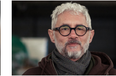
RICHARD RÜGER Männlich versus Weiblich [An-]Sichten [Gemälde Acryl, Pastell, Stift] Hengersberg