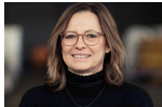
SIBYLLE KASPARY Beam Me Up [Acryl- und Öl-Gemälde] Frankfurt