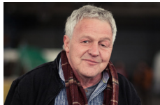
THOMAS ALTMANN Glasgrüße an P.S. [Fotografien] Dessau-Roßlau