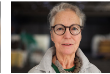
CLAUDIA LINGEN Die Dinge des Lebens [Malerei auf Seide] Hüffelsheim