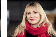
NATALIA SIMONENKO Bühne und Tanz [Öl-Gemälde] Stuttgart